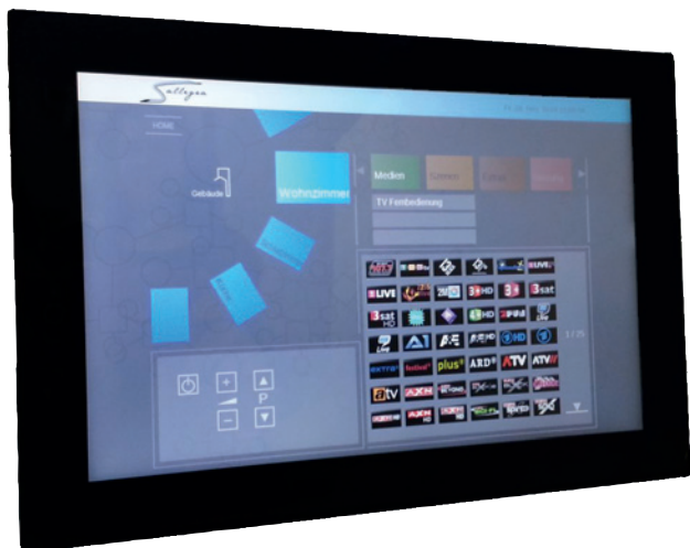
Einfach zu bedienen: Steuerpanel mit Multitouch-Technologie