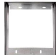
Cadre de protection contre les intempéries Helios AP pour 2 modules Casquette pour montage en extérieur