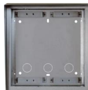
Boîtier d'encastrement Helios avec cadre de protection contre les intempéries UP pour 2 modules Boîtier d'encastrement pour montage en intérieur ou en extérieur