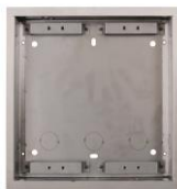
Boîtier d'encastrement Helios UP pour 2 modules Boîtier d'encastrement pour montage en intérieur