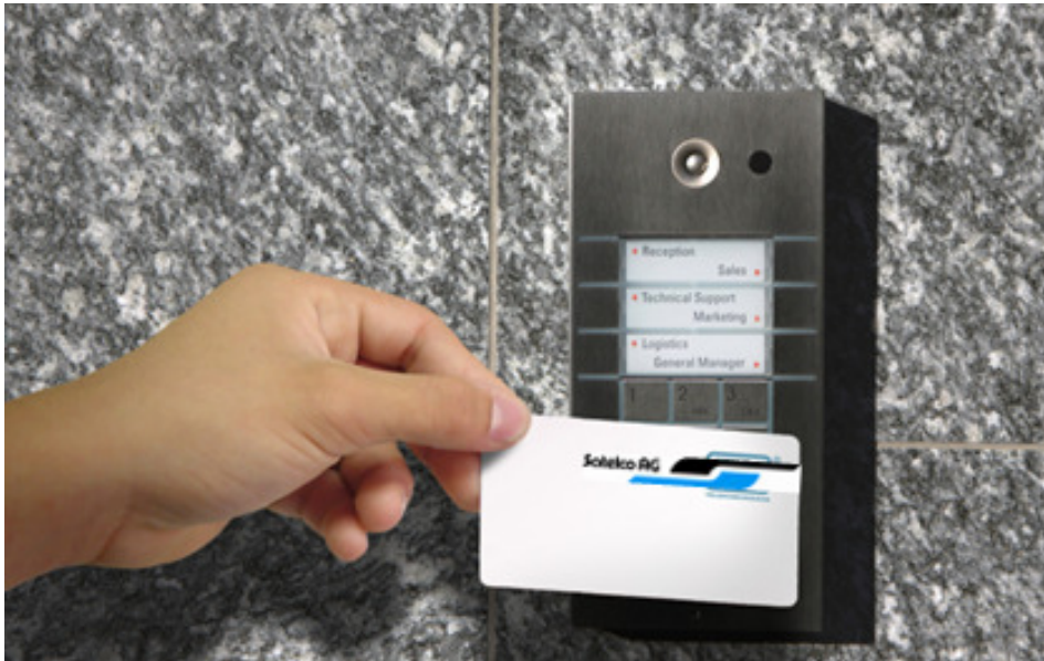
APS Mini Plus